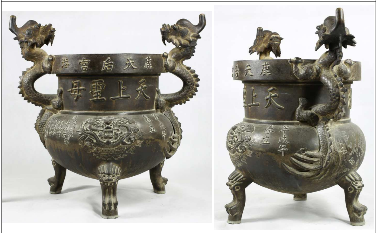
附件：鹿港天后宮香爐圖片