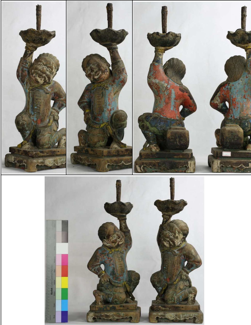
附件：鹿港天后宮胡人負重燭臺一對圖片