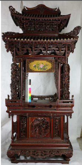
附件：鹿港天后宮鳳輦圖片