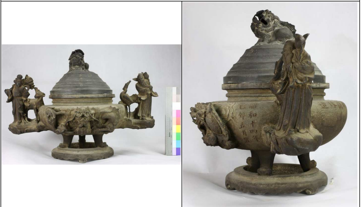
附件：鹿港天后宮石薰爐圖片