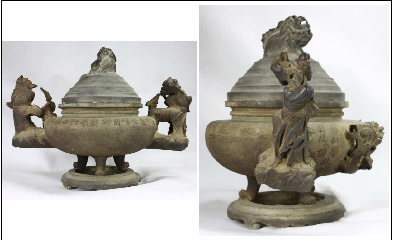
附件：鹿港天后宮石薰爐圖片-「其它面向」與「特殊銘文、記號」部位照片