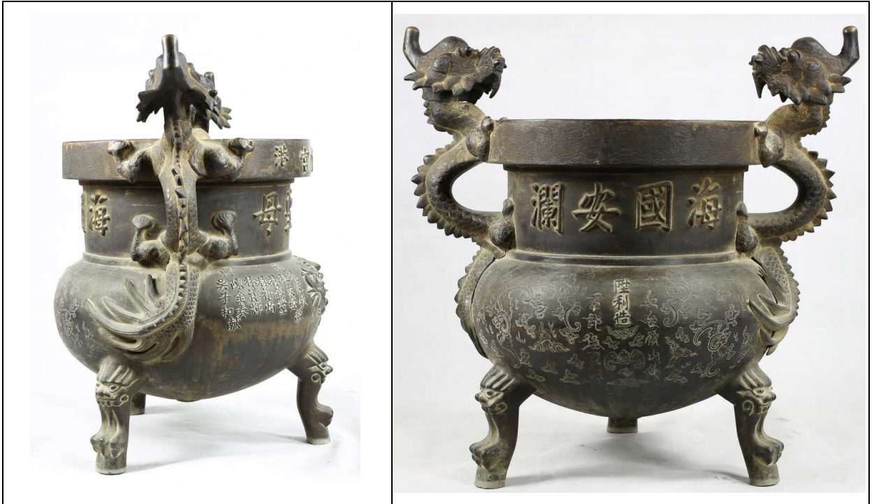
附件：鹿港天后宮石薰爐圖片-「其它面向」與「特殊銘文、記號」部位照片